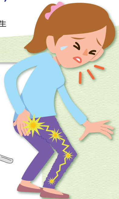
腰から足へ広がる痛み・しびれ